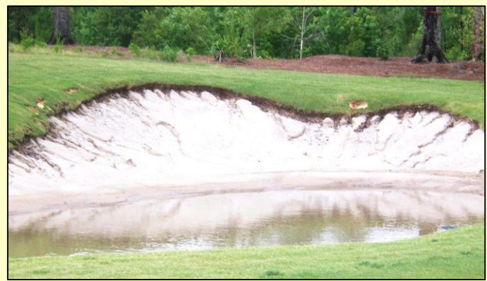
Erodierter Bunker ohne Polyplast